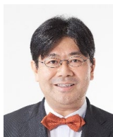
山田太郎 参議院議員