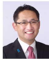
松田正 鳥取県議会議員