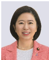
自見はなこ 参議院議員