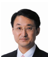
平井伸治 鳥取県知事